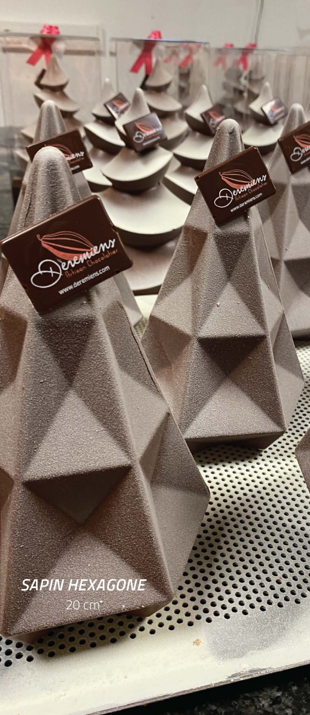
SAPIN HEXAGONE 20 cm*