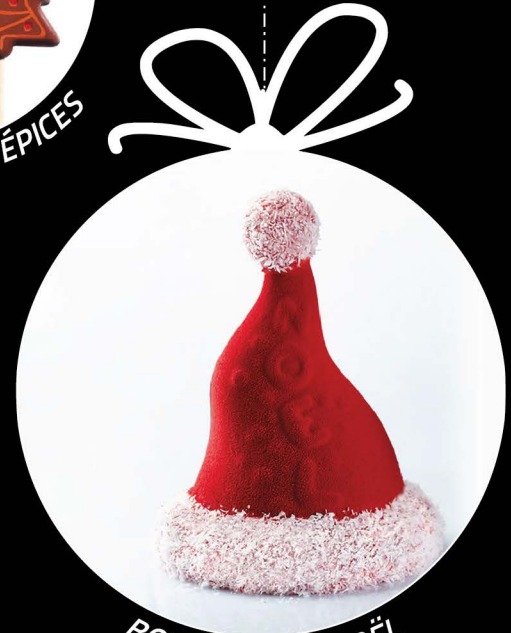
BONNET PÈRE NOËL 17 cm