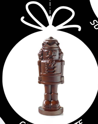
CASSE-NOISETTE 17 cm