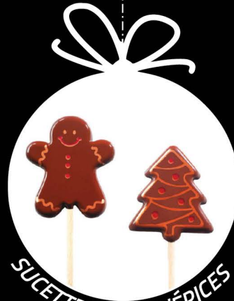
SUCETTES PAIN D'ÉPICES