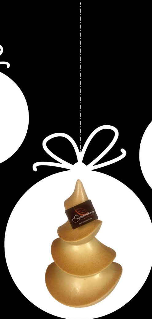
SAPIN VAGUE 20 cm