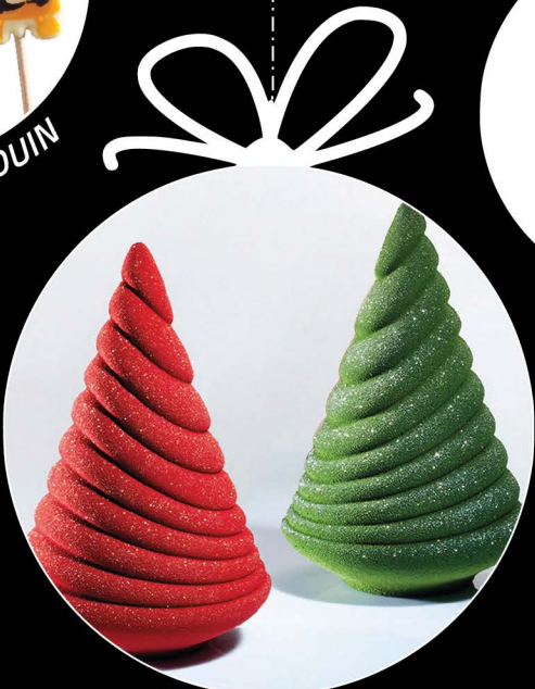
SAPINS LIGNES 20 cm