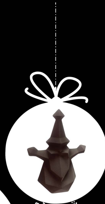
PÈRE NOËL 20 cm