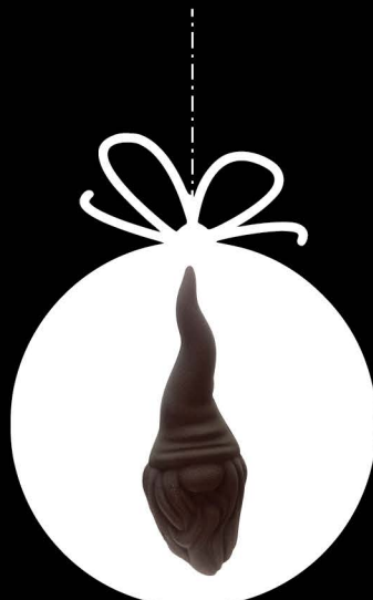
LUTIN 20 cm

Moulages réalisés dans notre atelier avec nos chocolats d'origine MAYATA noir, blanc ou au lait.