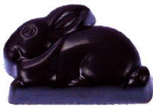
Lapin Noir Ganache pistache