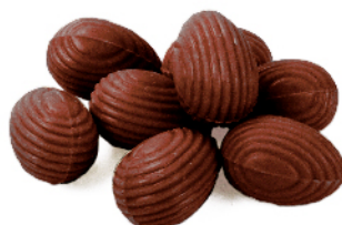
Lait praliné noisettes du Piémont