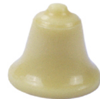
Cloche Blanche Ganache noire truffée