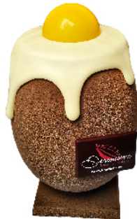
Oeuf sur le plat Garni