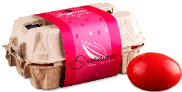
Boîte de 6 oeufs colorés