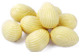
Blanc praliné noisettes du Piémont