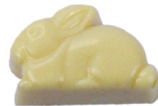
Lapin Blanc Ganache fraise