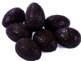
Noir praliné coco