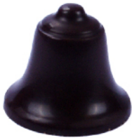
Cloche Noire Ganache vanille