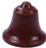
Cloche Lait Caramel beurre salé