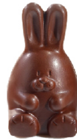
Lapin dodu Garni