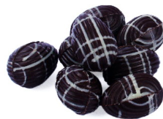
Noir praliné noisettes du Piémont