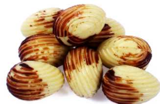
Blanc praliné croquant café