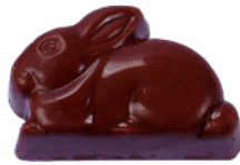
Lapin Lait Ganache spéculoos